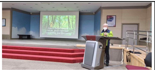
- 2021 농업기술원 하반기 직원 힐링 교육