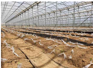
1년생 절절묘('24년 공급용)