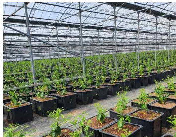
2년생 화분묘('23년 공급용)