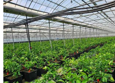
3년생 화분묘('22년 공급용)