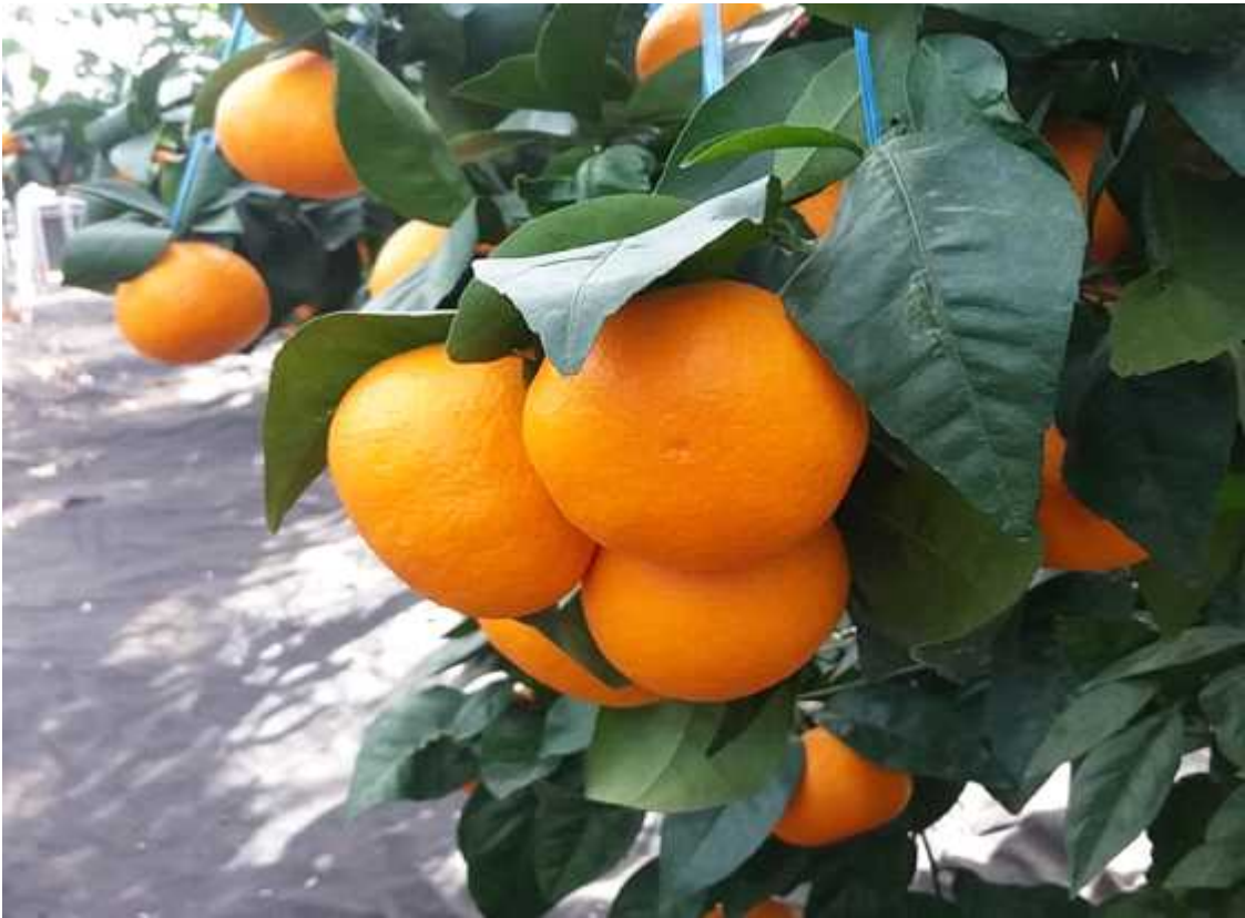
설향 열매 모습

※ 설(1월)에 수확이 가능한 만감류 품종은 레드향이 있지만, 열과와 해거리 현상이 심한 편임