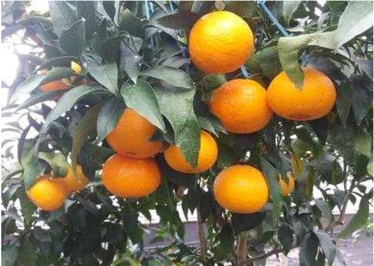
달코미 열매 모습

제주특별자치도농업기술원에서 2020년에 출원한 품종으로 12월 수확이 가능하고 껍질 벗기기가 쉬우며, 맛이 좋음