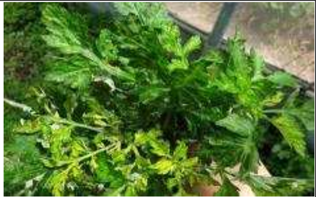
하우스 내 제초제 피해 의심증상