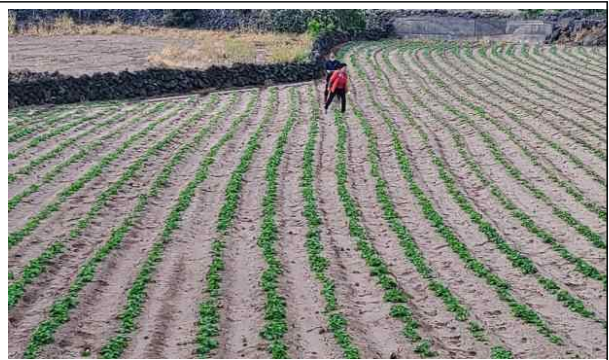
제초제 피해 사진