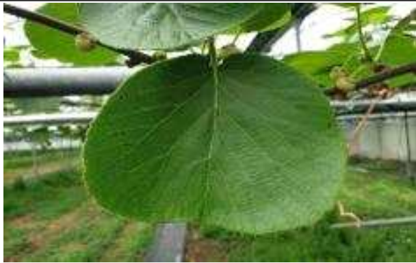
키위 잎 제초제 피해 의심증상