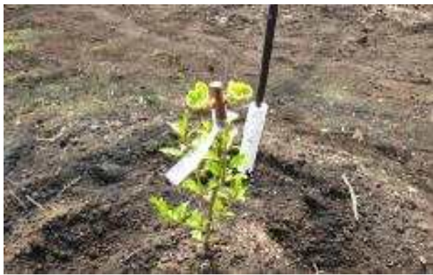
키위 발아상태 확인