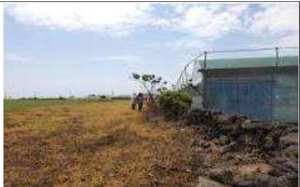
인근 제초제 살포 포장