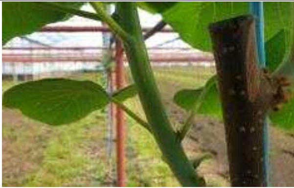
키위 껌집증상 초기