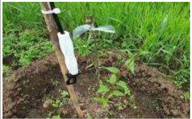
키위 발아상태 확인