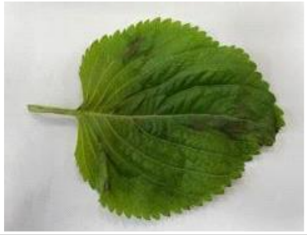
약해(가스발생) 추정 피해