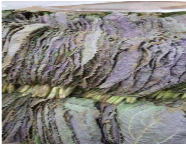
수확 후 다음 날 피해