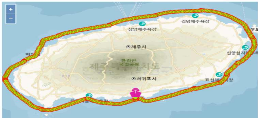
2025년 9월 18일 해양환경방사선량률 변동추이