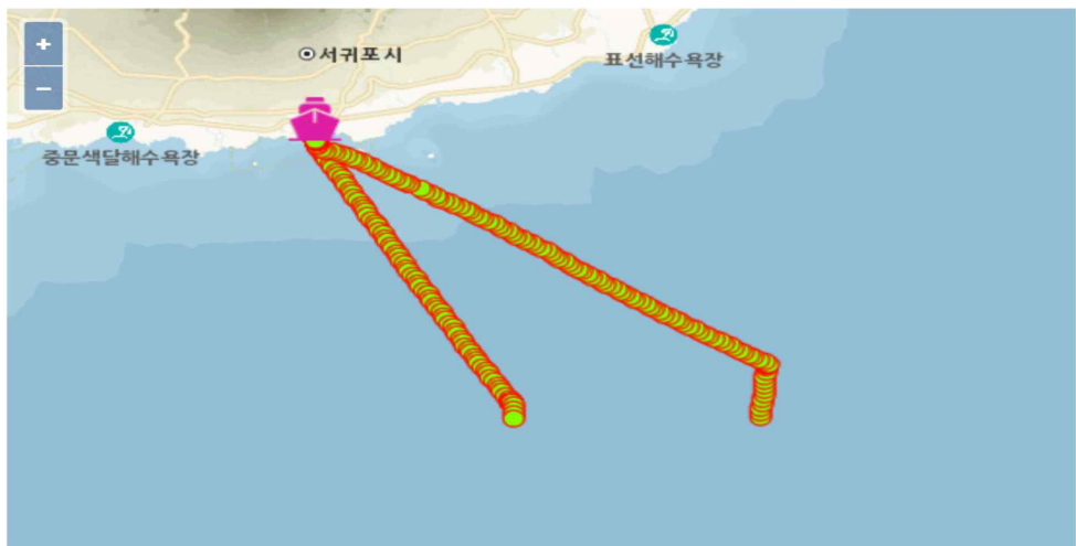
< 해양환경 방사선량률 변동 추이('25.11.20.) >