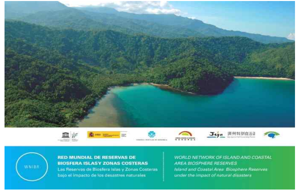
(제4차 회의사례집 표지 사진)