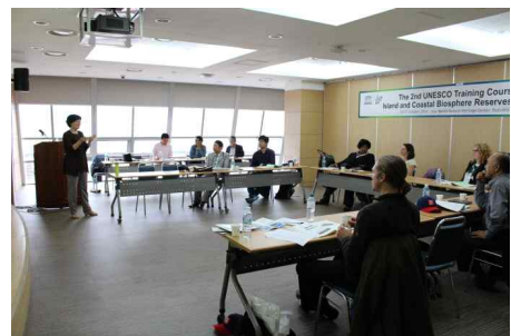
(제2차 관리자교육 강의 사진, 2015년 10월)

이 교육 프로그램을 통해 서로간 정보공유의 기회도 갖고 체계적인 관리시스템 구축을 할 수 있는 발판을 마련하였으면 하는 바람이다.