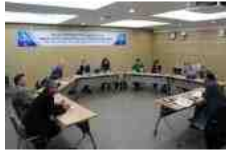
(제3차 관리자교육 강의 사진, 2015년 10월)

이 교육 프로그램을 통해 서로간 정보공유의 기회도 갖고 체계적인 관리시스템 구축을 할 수 있는 발판을 마련하였으면 하는 바람이다.