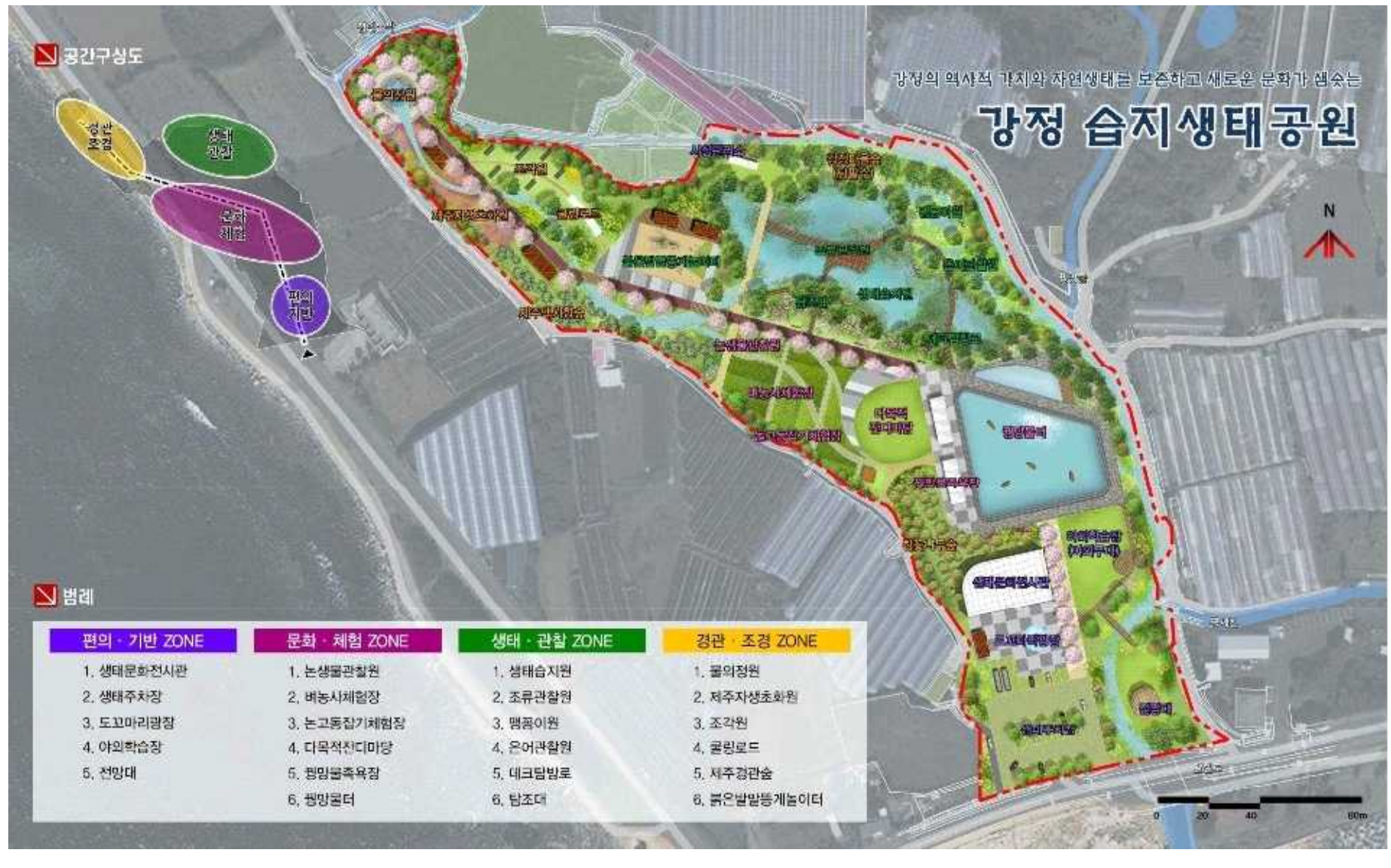
[붙임1] 자연환경보전·이용시설 설치계획도