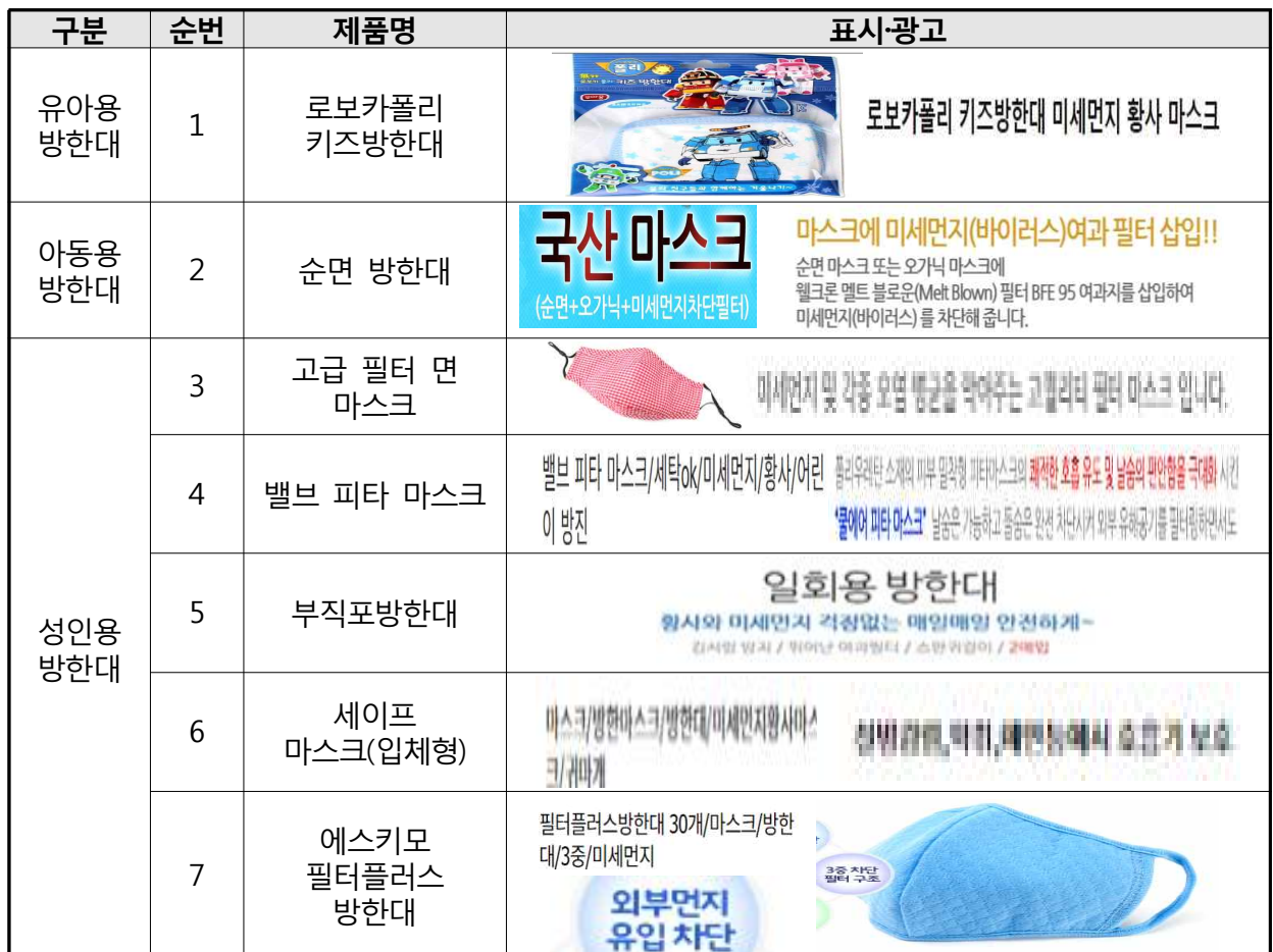
[ 소비자 오인 우려 표시·광고(온라인 쇼핑몰) 제품(15개) ]