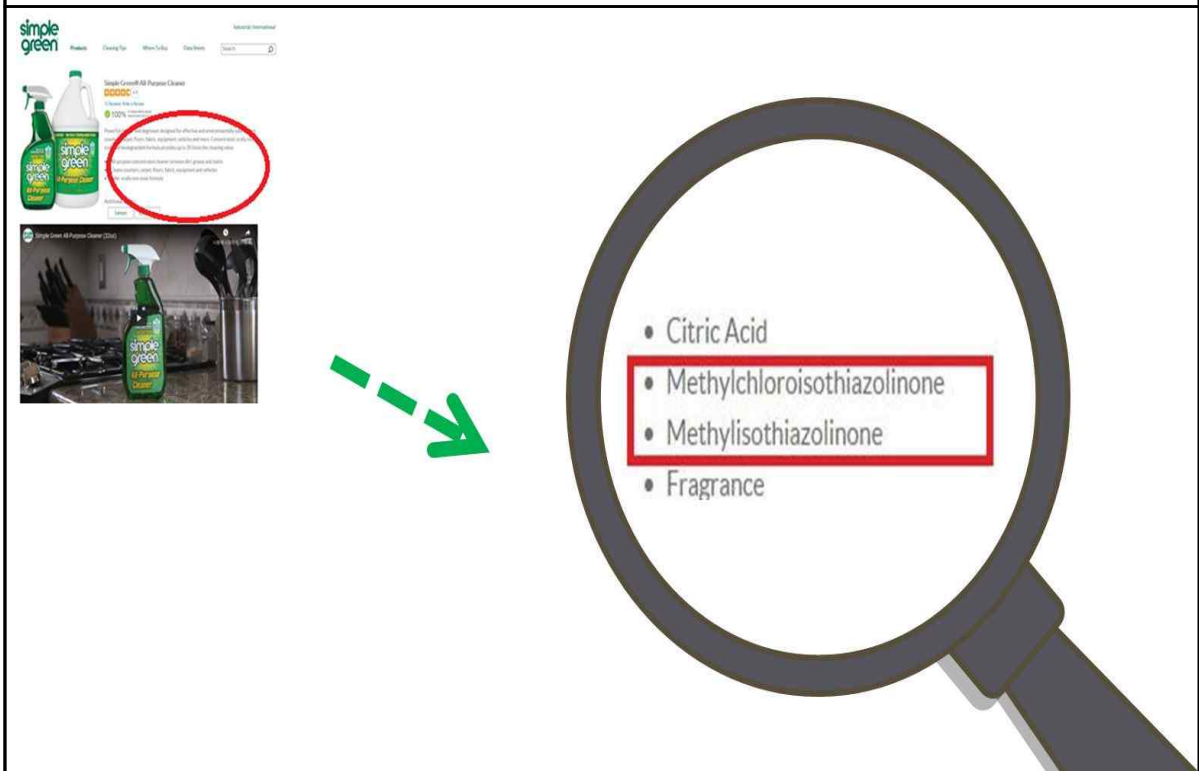
브랜드 홈페이지에 성분 목록 CMIT, MIT 표시