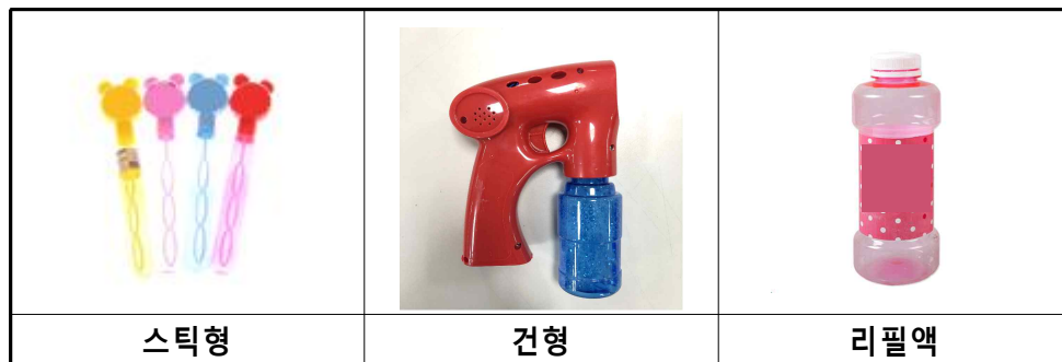
[ 시중에 판매 중인 비눗방울 장난감 종류 ]