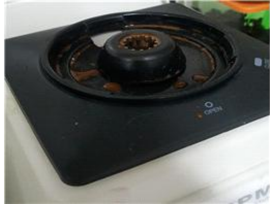
<본체로 흘러내린 녹물>