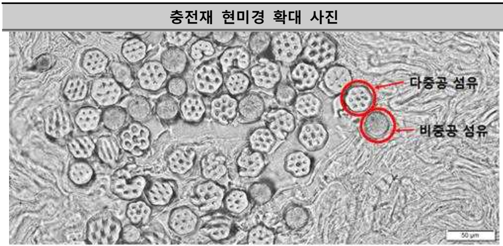
표13 [ 충전재 구성 확인 결과 ]