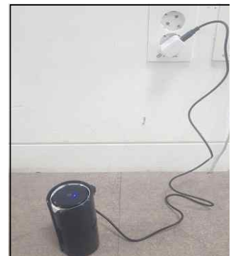
<휴대전화 충전기 연결>