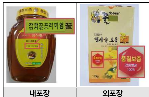
[ 지리산뱀사골 사양벌꿀 표시 ]